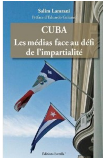
Cuba. Les médias face au défi de l'impartialité par Salim Lamrani