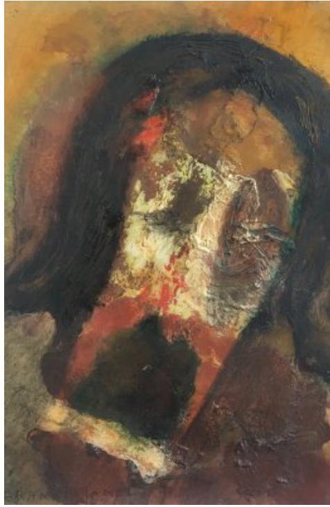
Le supplicié Dernière oeuvre réalisée par Djamel Branki avant sa mort.