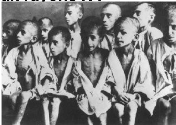
Enfants survivants du camp de concentration de Ravensbrück en 1945