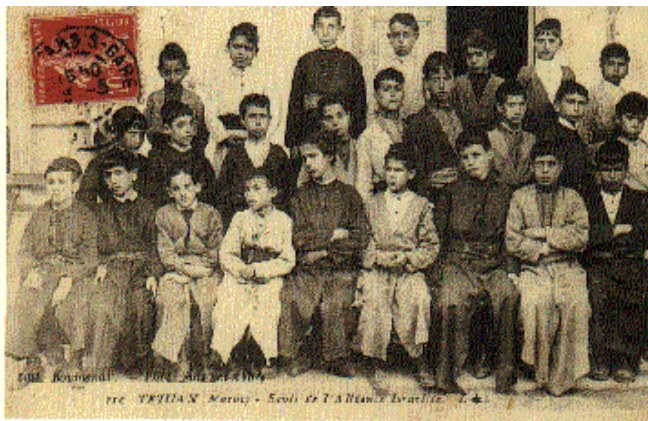
Ecole juive au Maroc au début du 20e siècle

Les sionistes ont la réputation bien méritée d'avoir été les pires antisémites de l'histoire . N'étant pas eux-mêmes des sémites, ils n'ont jamais réellement adhéré au judaïsme religieux. Lors de la création de l'état d'Israël en 1947, une force de répression plana autour des Juifs sépharades. On essaya de les endoctriner dès leur arrivée en Palestine. Il fallait qu'ils comprennent que leur foi en Dieu était dénuée de logique et de fondement, que la religion n'était que le fruit de régimes réactionnaires.