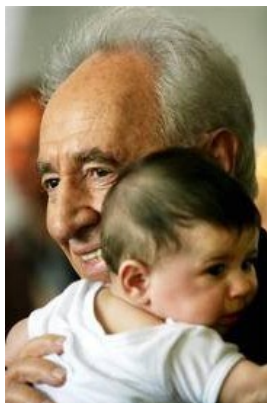
Shimon Peres semble aimer les enfants

Inutile de préciser que s'il avait existé une once de décence dans la profession médicale israélienne, ces hôpitaux auraient du être débaptisés au plus vite !