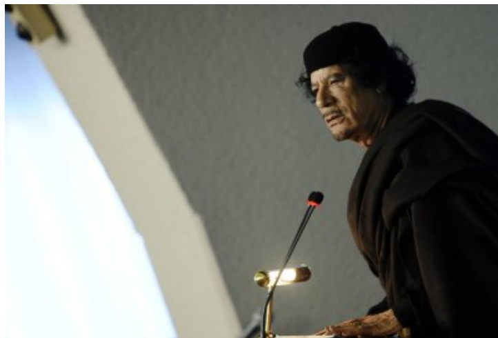
Le dirigeant Libyen Muammar Gaddafi.

La sodomie publique du président libyen Mouammar Kadhafi à l'aide d'une baïonnette rebelle fut accueillie par la secrétaire d'état américaine avec ces mots : « Nous sommes venus, nous avons vu, il est mort ». Son assassinat ainsi que la destruction de son pays ont été justifiée par un mensonge classique : il planifiait un génocide contre son propre peuple. « Nous savions que si nous attendions un jour de plus, Benghazi, une ville de la taille de Charlotte, aurait subi un massacre qui aurait eu des répercussions sur toute la région et aurait créé une tache sur la conscience du monde », a prétendu le président Obama.