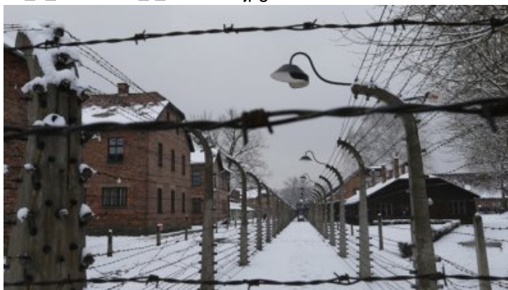
Vue générale du camp d'extermination à Auschwitz - 26.01.15

Si les nazis n'avaient pas envahi l'Europe, Auschwitz et l'holocauste ne se seraient jamais produits. Si les États Unis et leurs alliés n'avaient pas commencé leur guerre d'agression en Irak en 2003, près d'un million de personnes seraient encore en vie aujourd'hui et l'État islamique ne serait pas en train de nous menacer de sa sauvagerie. Ce dernier est le rejeton du fascisme moderne, nourri par les bombes, les bains de sang et les mensonges de ce théâtre surréaliste que l'on appelle les actualités.