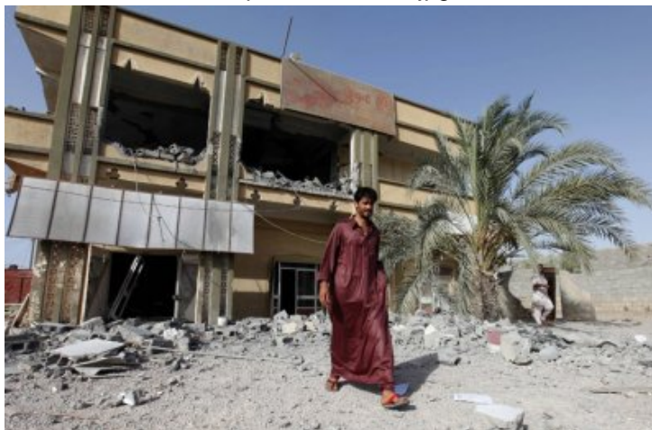
Batiments détruits par l'OTAN à 150 km à l'est de Tripoli en Lybie

<a href="IMG/jpg/batiments_detruits_par_otan_a_150_km_est_de_tripoli-21.07.2011.jpg" title='JPEG - 163.7 ko' type="image/jpeg">