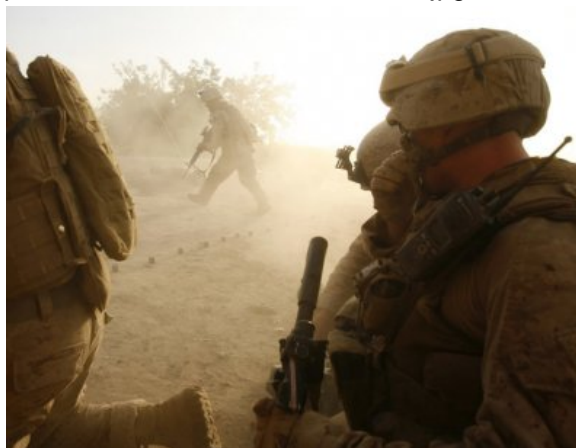
Combat des Marines US contre les talibans dans la province de Helmand 5 avril 2010.

<a href="IMG/jpg/combats_marines_us_contre_les_talibans_province_de_helmand-05.04.2010.jpg" title='JPEG - 93.1 ko' type="image/jpeg">