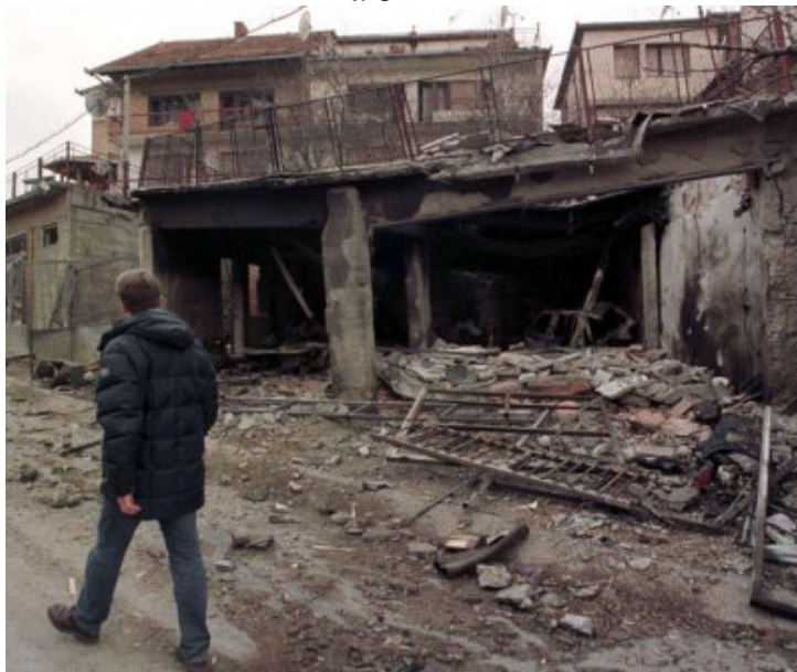
Pristina (Kosovo) après les bombardements de l'Otan 29 mars 1999.

<dl class='spip_document_1119 spip_documents spip_documents_right' style='float:right;'><a href="IMG/jpg/pristina_kosovo_apres_bombardements_otan_le_29.03.99.jpg" title='JPEG - 193.7 ko' type="image/jpeg">